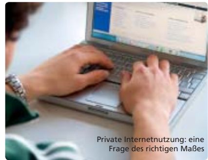
Private Internetnutzung: eine Frage des richtigen Maßes

Umkehr der Steuerschuldnerschaft: Bei bestimmten Leistungen hat nicht der leistende Unternehmer die Umsatzsteuer an das Finanzamt abzuführen, sondern der Leistungsempfänger. Die Umkehr der Steuerschuldnerschaft wird ab 2011 erweitert auf steuerpflichtige Lieferungen von Industrierohstoffen und sonstigen Abfallstoffen und die steuerpflichtige Reinigung von Gebäuden.