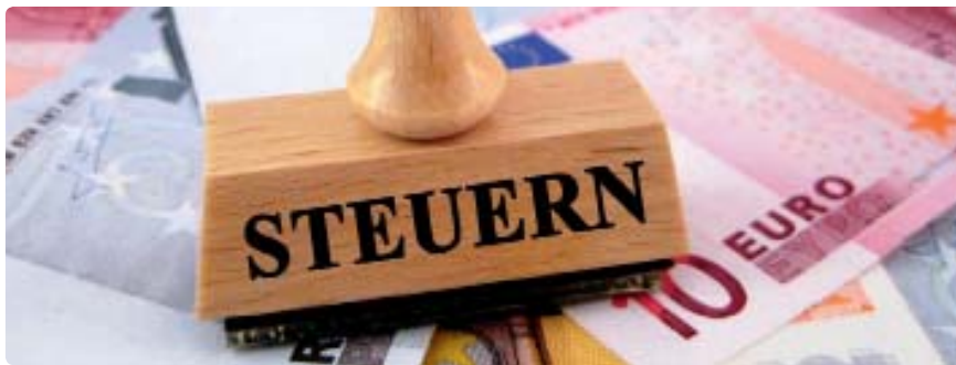
Die deutschen Steuerzahler werden angesichts leerer öffentlicher Kassen weitere Belastungen tragen müssen

► INFOS: www.baufe.de/personal/newsDetails?newsID=1271842150.72