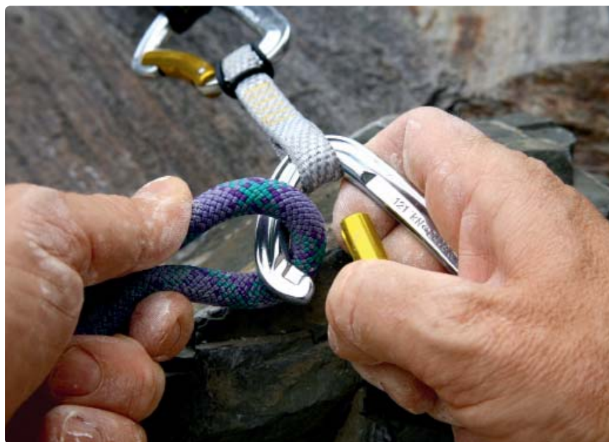
Mittelständische Unternehmen vertrauen mehrheitlich in Finanzfragen auf das Fachwissen ihrer Hausbank

In der Finanzkrise hat die auf europäischer Ebene viel kritisierte Bodenständigkeit deutscher Regionalbanken Einbrüche in der Mittelstandsfinanzierung verhindert. Genossenschaftsbanken und Sparkassen haben ihre regionale Verantwortung wahrgenommen. Nach wie vor besitzt aber die Kreditfinanzierung einen zu hohen Stellenwert. Einerseits erweist sich für mittelständische Unternehmen der Markt für Beteiligungskapital als intransparent, andererseits scheuen viele Unternehmer die Aufnahme neuer Gesellschafter. Mittlerweile werden zahlreiche neue Finanzierungsprodukte angeboten, die Eigenfinanzierung bleibt aber die wichtigste Quelle bei Innovationsfinanzierungen. Sie ermöglicht es den Banken vor Ort, ihre Kreditversorgung auszuweiten und damit auch schnell wachsende Unternehmen zu begleiten. Zugleich sind die Banken wichtige Mittler zu den immer wichtiger werdenden Angeboten der KfW und LfA geworden. Unternehmen sollten sich deshalb noch intensiver über ihr Leistungsangebot informieren.